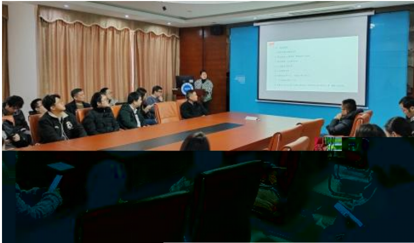
图 员工专业技能培训

2023 年，公司 促 进 发 展 和 才 方 得 成 功。 过 创 造 的 和 平， 不 动 公 司 的 持 续 成 长， 工 供 应 的 发 展 机 会。 过 供 多 样 化 的 和 发 展， “ 队 伍 共 建 ” 等 活 动 ( 4-5)， 帮 工 技 术 和 管 理； 并 的 和 规 划， 工 的 合 作 和 包 导 发 展 计 划、 技 术 及 部 等， 地 促 进 工 的 方 发 展。