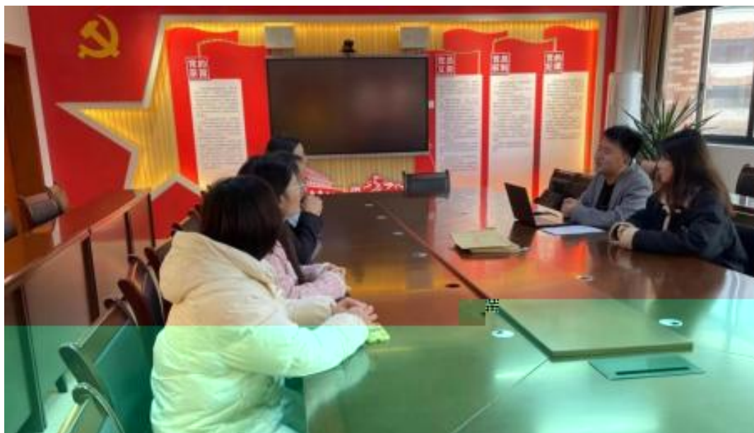
图 校企开展学术研讨项目交流会议

公 高度 队的 ，充分 到 和 的关 ，对 高 和 关 的 。此公 供 ，包 更 、 方法 及 导 发 程，并 持 丰富 的 家 过 、 会和 际案 ， 队 分 的 和 。 常 地 活动， 包 参加 会 、 等 ， 促 调 的 分 ， ， 并 的 队 ( 1)。